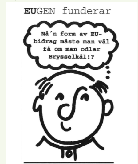
Ur Utsikt Värmland nummer 2, 1995.