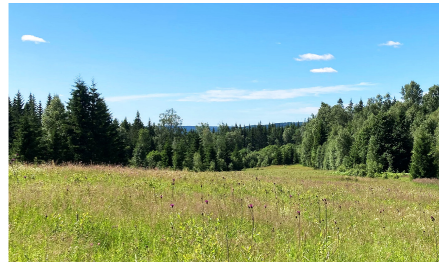
Det är framför allt slätterängar, sätrar och andra små gräsmarker i skog som är starkt hotade i Värmland.