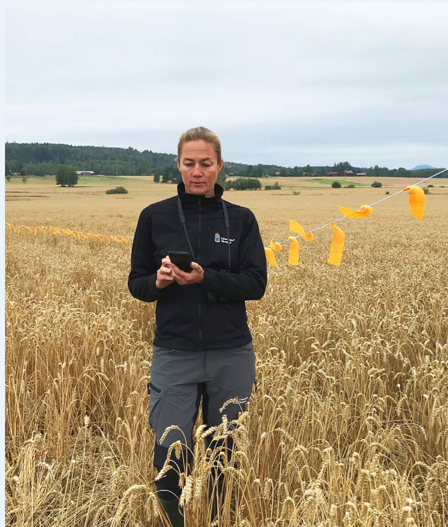
Det är viktigt att anmäla en fågelskada före tröskning.