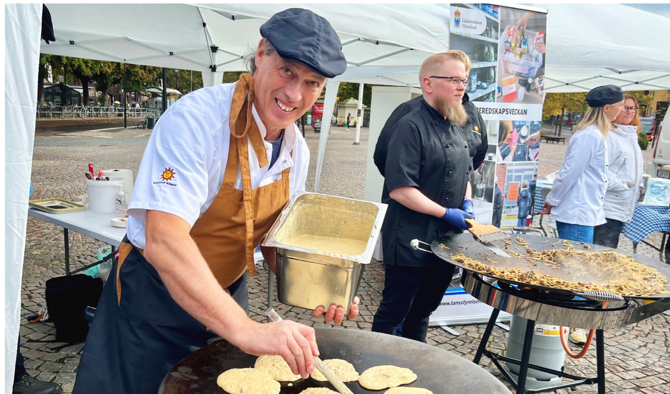
Kockar från Karlstads kommun lagade och serverade flera av rätterna från receptsamlingen under invigningen av Krisberedskapsveckan 2022.

Har du kriskost för minst en vecka hemma i skafferiet? Olika aktörer har listor med tips på mat som är bra att ha hemma för vår beredskap. En förvånansvärd hög andel av dessa livsmedel är dock importerade. Det är sårbart! Detta var utgångspunkten för projektet som resulterat i receptsamlingen "Mat härifrån – recept för vardag och krisberedskap".