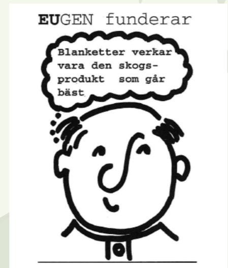
Ur Utsikt Värmland nummer 1, 1995.

Värmland bär en skönhet som vi inte vill vara utan och som kommande generationer inte får berövas.”