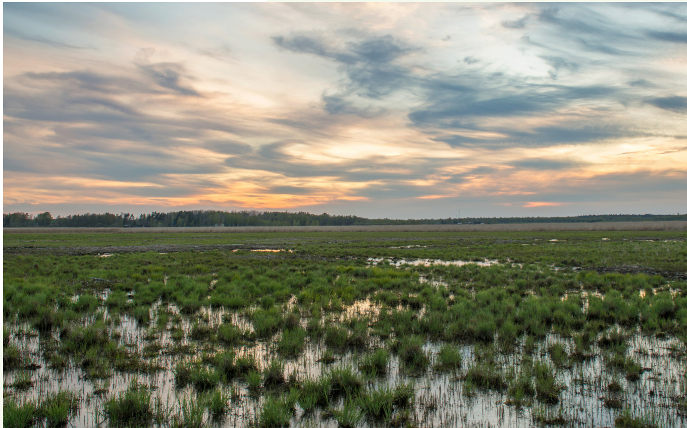
Arealen strandäng ökar om vattenståndet får bli högt på våren och sedan sjunka undan. Stora arealer strandängar är gynnsamt för att bevara biologisk mångfald.