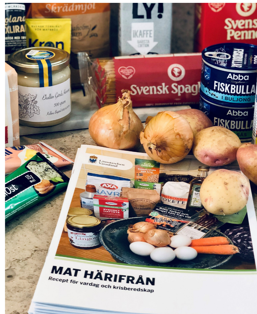
Svenska och närproducerade livsmedel – för vardag och krisberedskap.

Vi har utgått från en krissituation där samhällets alla funktioner har minskat till hälften, det omfattar både tid och tillgänglighet. Det gäller el, vatten, transporter och elektroniska kommunikationer som till exempel internet. Att ha en planering och ett beredskapslager med kriskost är