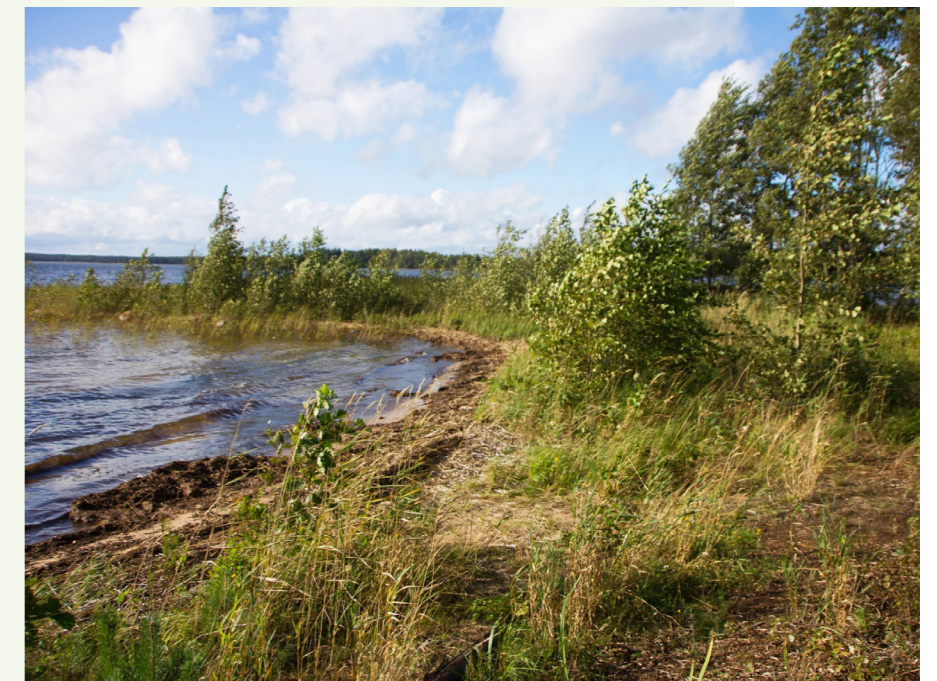
Ständigt lågt vatten i Vänern har gjort att stränderna växt igen. Måsar och tärnor överger sina skär eftersom de måste ha fri sikt vid sina bon.