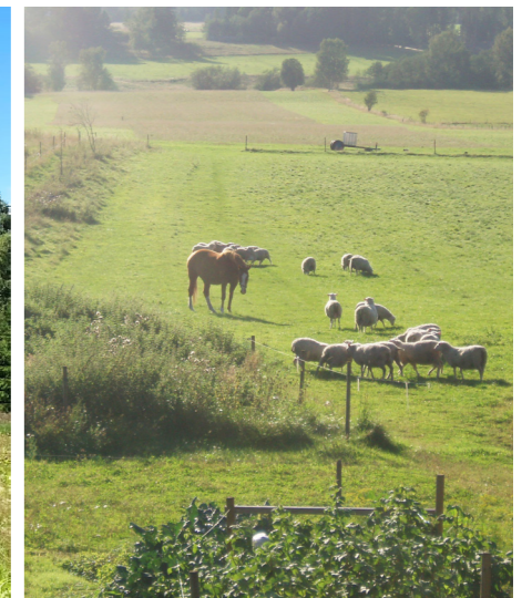
För att nå miljömålet för odlingslandskapet behövs betesdjur och småskaliga landskap.